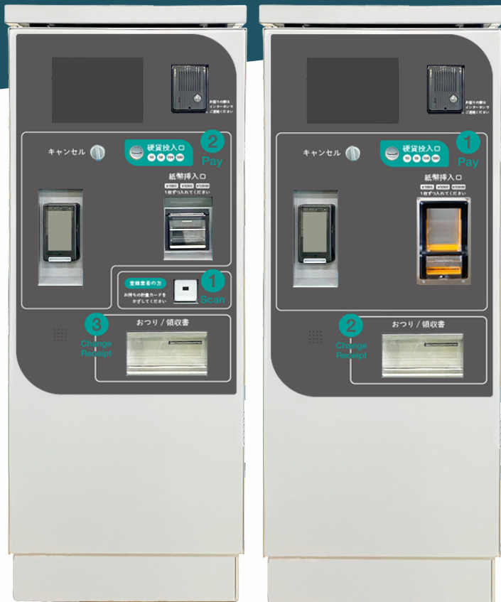
▲リサイクルビルバリ BCA-10 登載 (NECマグナスコミュニケーションズ製)